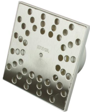
Doucheput met RVS rooster 15 cm x 15 cm