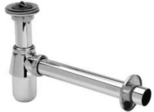
Viega Plugbekersifon met muurbuis en rozet, chrom