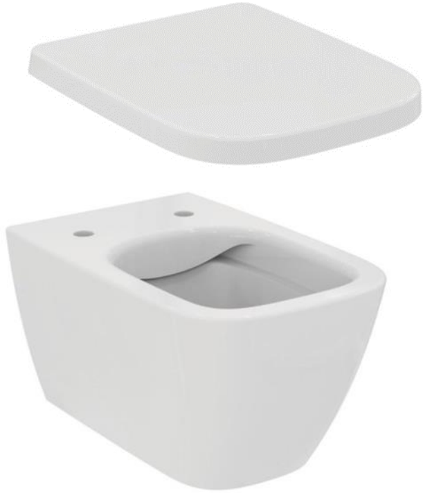
Ideal Standard Wandcloset, i.life rimless met wrapover zitting en deksel, kleur wit