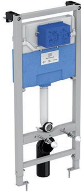
Ideal Standard Inbouwreservoir