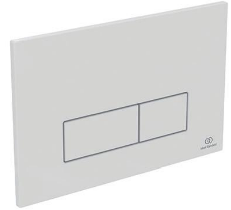
Ideal Standard Bedieningspaneel Oleas M2 wit